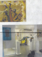
Langrijke evenementen van 2011. De agenda wordt uitgegeven bij de Mon Art Gallery.

Een gedicht waaris ze op een voorrederlike en inspirerende manier beschrijft hoe ze haar strijd tegen kanker heeft overleefd. In deze 10 jaar later ook weer terugkijken naar dat in een geest van nieuw. Ze roept zich dat wat begon bij het verlaten van een beroep van twee, resulteerde in een compleet nieuwe identiteit. Ze is nu een kunstenaar, een schrijfster, een spreker, een auteur van boeken, een dichter, een vrouw die haar leven en haar werk samenbrengt. Ze is nu een kunstenaar, een schrijfster, een spreker, een auteur van boeken, een dichter, een vrouw die haar leven en haar werk samenbrengt. Ze is nu een kunstenaar, een schrijfster, een spreker, een auteur van boeken, een dichter, een vrouw die haar leven en haar werk samenbrengt.